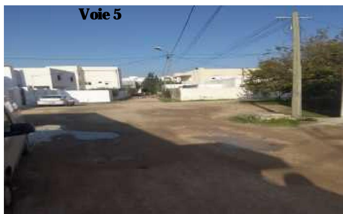
Terre nue dépourvue de chaussée et de trottoir Stagnation des eaux pluviales