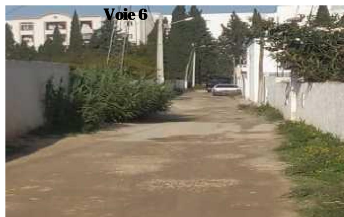
Terre nue dépourvue de chaussée et de trottoir. Présence de quelques plantes