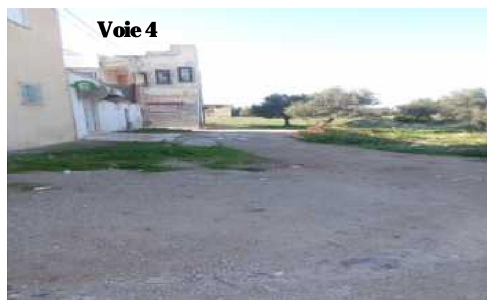
Terre nue dépourvue de chaussée et de trottoir. Présence de quelques plantes.