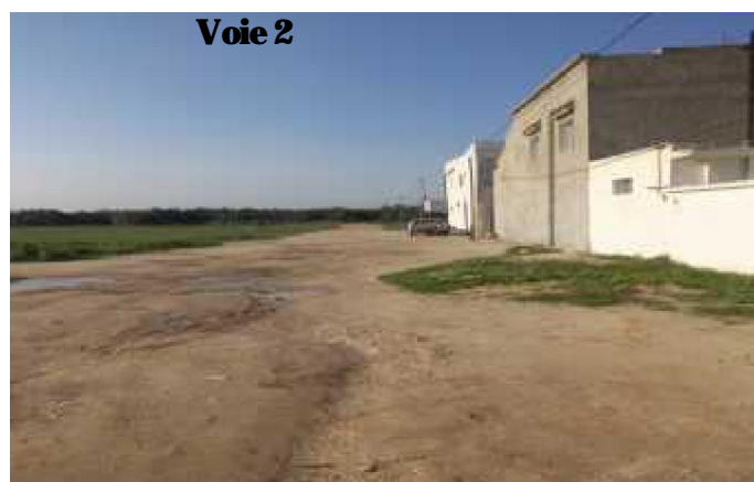
Terre carrossable dépourvue de chaussée et de trottoir