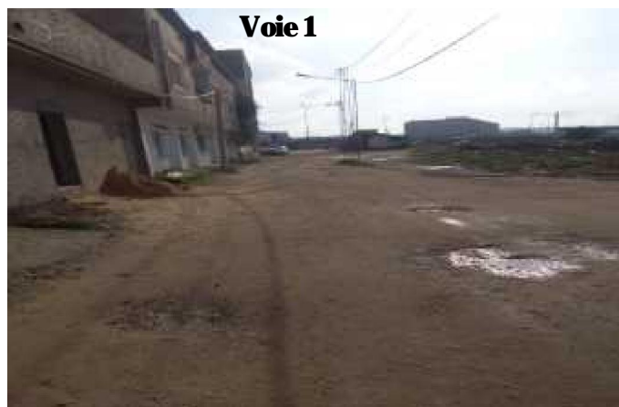
Terre carrossable dépourvue de chaussée et de trottoir